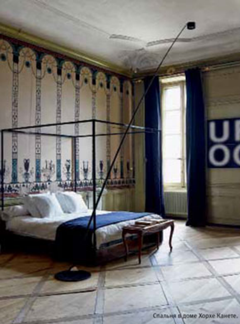
Спальня в доме Хорхе Канете.