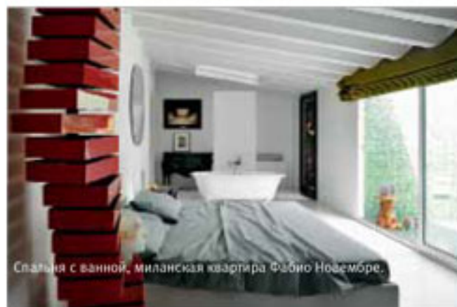
Спальня с ванной, миланская квартира Фабрио Новембре.